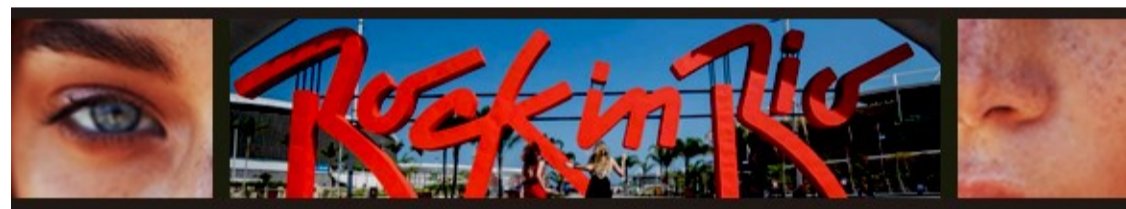
Eyes and Skin

:: SEPTEMBER – Barra da Tijuca will host two medical congresses which are expected to receive over 10,000 professionals: from the 4 th to the 7 th , the 63 rd Brazilian Ophthalmology Congress; and from the 11 th to the 14 th , the 74 th Congress of the Brazilian Dermatology Society. On the 27 th , another edition of the biggest entertainment festival in the world begins. The Olympic Park hosts Rock In Rio 2019, with domestic and international concerts. Over 700,000 people will go through the City of Rock until October 6 th .