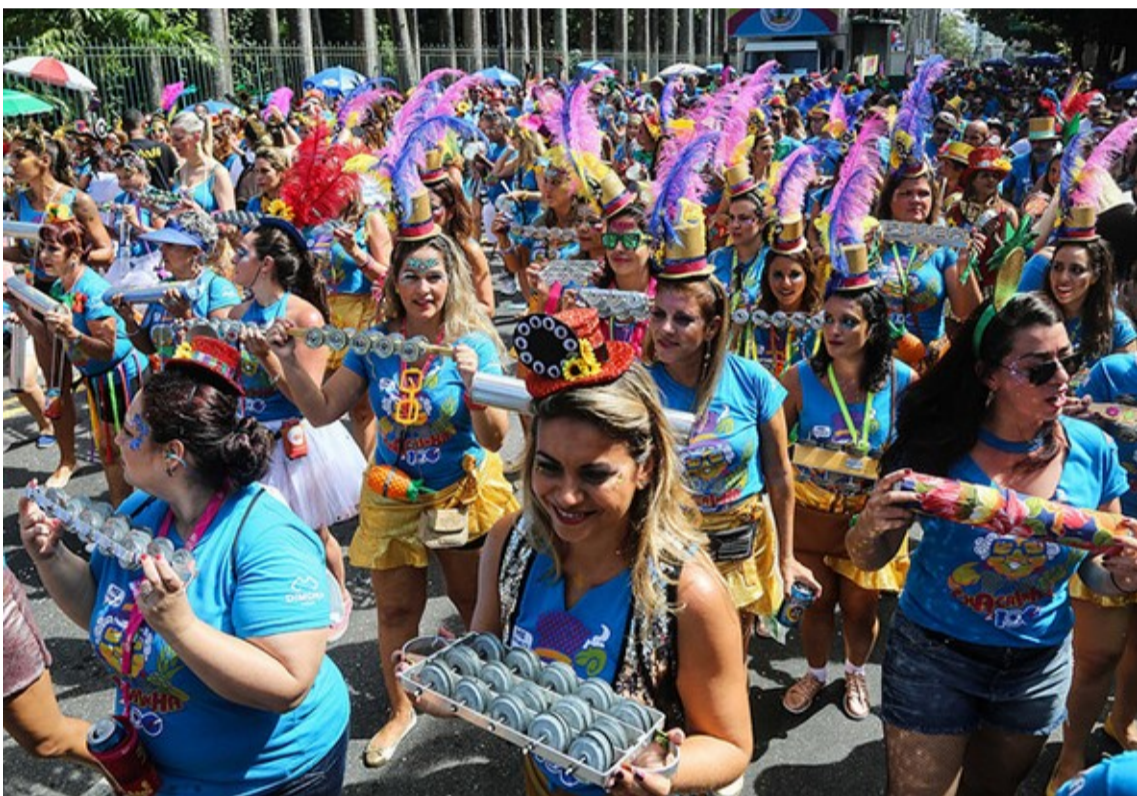
Bloco Me Esquece. Jardim Botânico

:: PRE-CARNAVAL – In November, the samba schools start getting into the groove. Most of them promote weekly exhibitions. Schools such as Mangueira, Salgueiro and Portela manage to gather 5,000 people every night. But it is not only the samba that moves the summer in Rio. At this time, the groups of Carnaval dancers, which were dearly embraced by the cariocas, start making their street exhibitions. The gatherings take place in the late afternoon and are free of charge. One of the most traditional amongst these groups is “Orquestra Voadora” (the Flying Orchestra), in the gardens of Rio’s Museum of Modern Art (MAM), in Rio’s South Side, on Sundays.