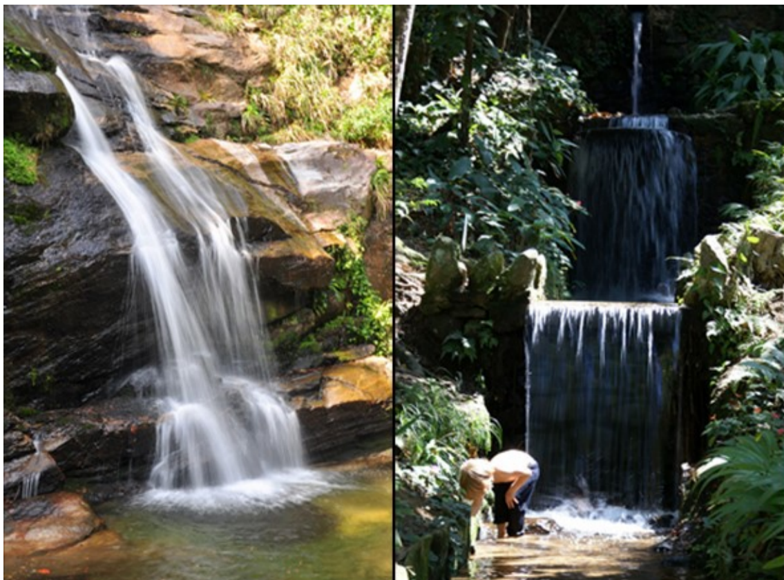
Floresta da Tijuca

:: WATERFALLS – The city, which grew between the mountains and the sea, houses the largest urban forest in the world, the Tijuca Forest, where you may enjoy several waterfalls, which are no less crowded than the beaches. During the summer, the water has a mild temperature and helps you to forget the stresses of everyday life. Some are very accessible, such as waterfalls Chuveiro, Quebra and Gruta, located in Horto, in Jardim Botânico. You can find them on short trails, following the Dona Castorina Road, in Horto. The Horto Waterfall is another one that is very popular and easy to find. You should arrive there early.