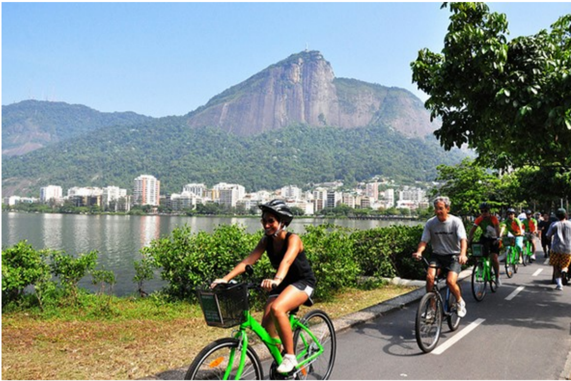
Lagoa Rodrigo de Freitas

:: CYCLING – Rio is the city with the third largest network of cycle lanes in Brazil. Overall, there are over 450 kilometers of lanes. Since 2011, the city has a municipal system of bicycle rental stations, and using them has become a habit among cariocas. You just need to download the app and sign up to rent the bikes. On weekends, areas such as Aterro do Flamengo and Lagoa Rodrigo de Freitas, in Rio’s South Side, have a private bicycle rental service.