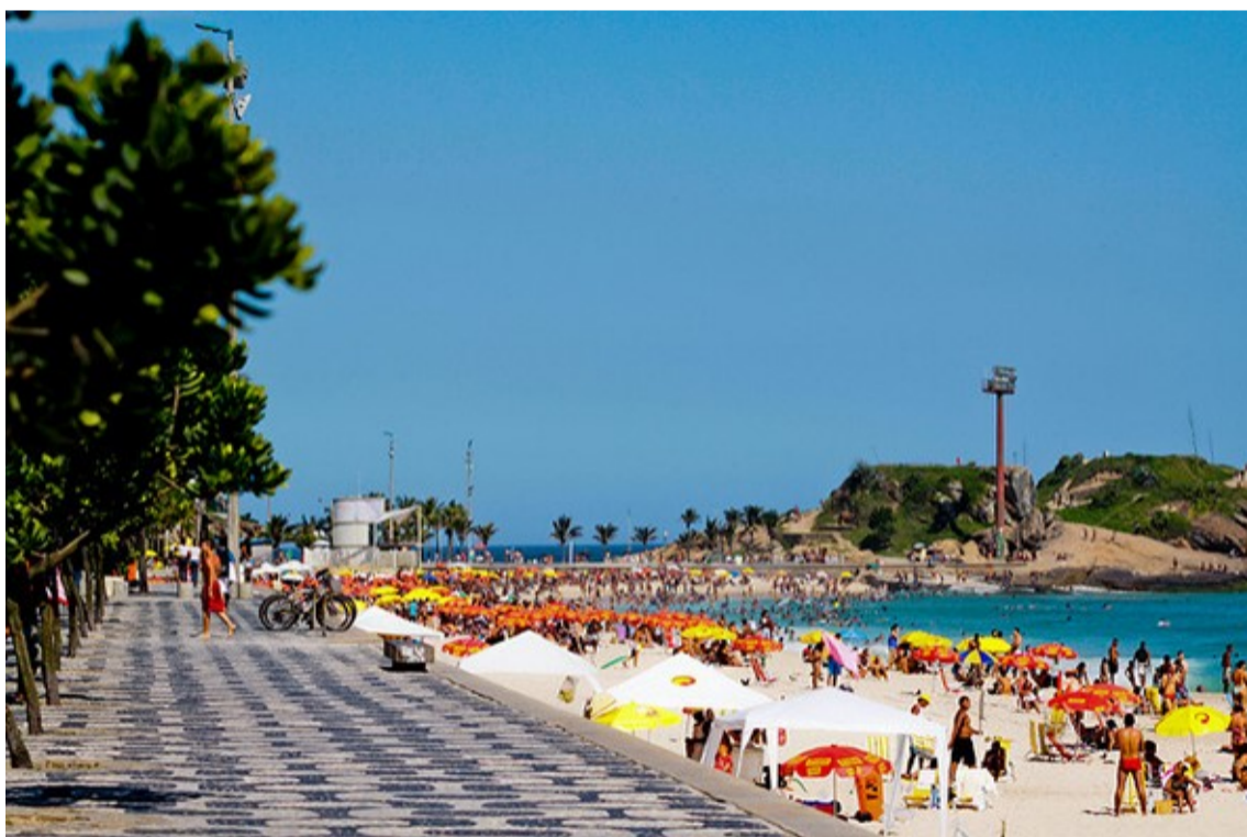
Arpoador

:: THE SANDS – During the day, the beaches of Rio boil up. And we are not talking about the temperatures exceeding 40°C. As people and vendors pass by frantically, cariocas do not forgo having some coconut water in one of the many kiosks lining up the seafront. An ice-cold beer, which is free to be consumed on the streets and beaches, also fits in well. On the sands, nothing is more carioca than ordering a glass of mate tea with lemon juice. The mixture is refreshing. If you get hungry, “biscoitos de polvilho”, which can be sweet or salty, are the favorite of those who live in the city.