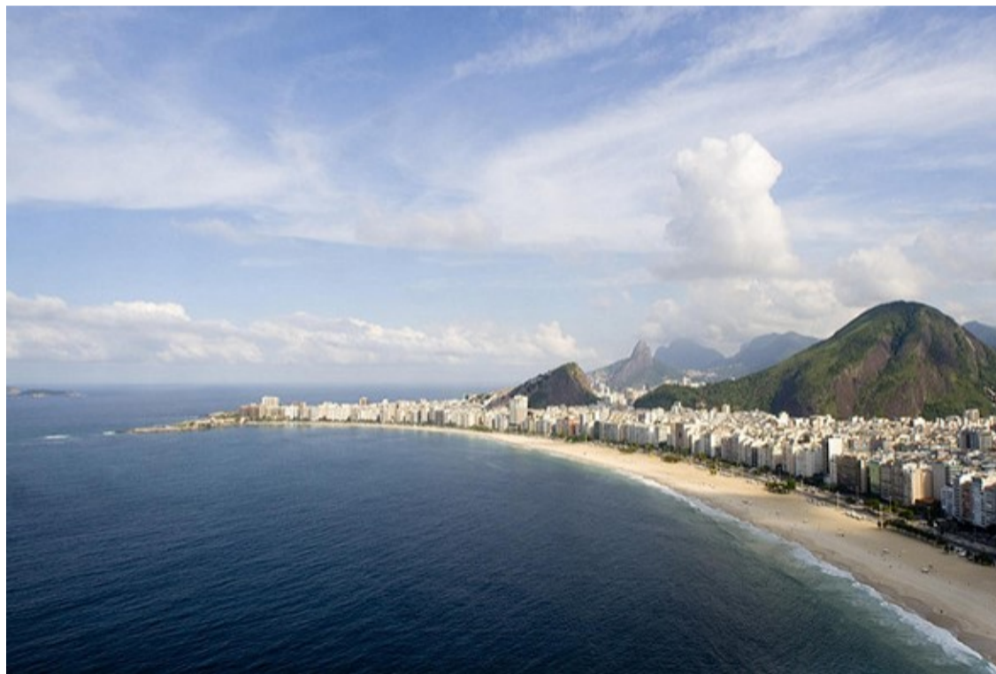
Copacabana Beach

2 – COPACABANA BEACH: Visiting Copacabana and Ipanema is almost mandatory for those visiting Rio. When added to its neighbor, Leme, the beach, located at Av. Atlântica, and its promenade, famous for its Portuguese mosaic stones imitate sea waves, is more than four kilometers long. Along Av. Atlântica visitors will find bike racks, bike lane, kiosks, hotels, bars and restaurants, frequented both day and night. It also has two Military Forts, one at each end of the beach, with panoramic views and open for visitors.