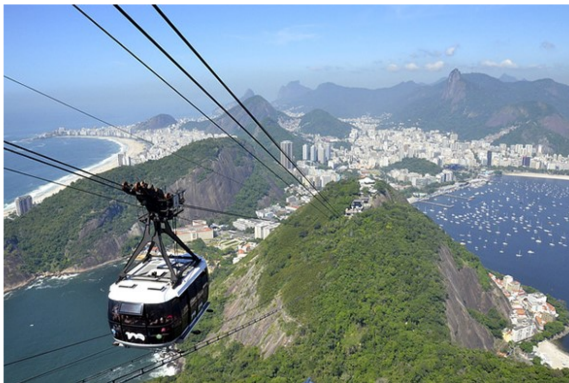
Morro da Urca track (Urca Mountain track) - Sugarloaf Mountain

3 – SUGARLOAF: Save an afternoon to visit the Sugarloaf. Going from Praia Vermelha (Red Beach), in Urca, South Region of the city, visitors first take a cable car heading towards the Urca Mountain and from there they take a second car that takes them to the top of the Sugarloaf Mountain - 396 meters above sea level. The view from the top of both mountains is breathtaking, as visitors get to see the Botafogo Cove, Copacabana Beach and the Guanabara Bay entrance.