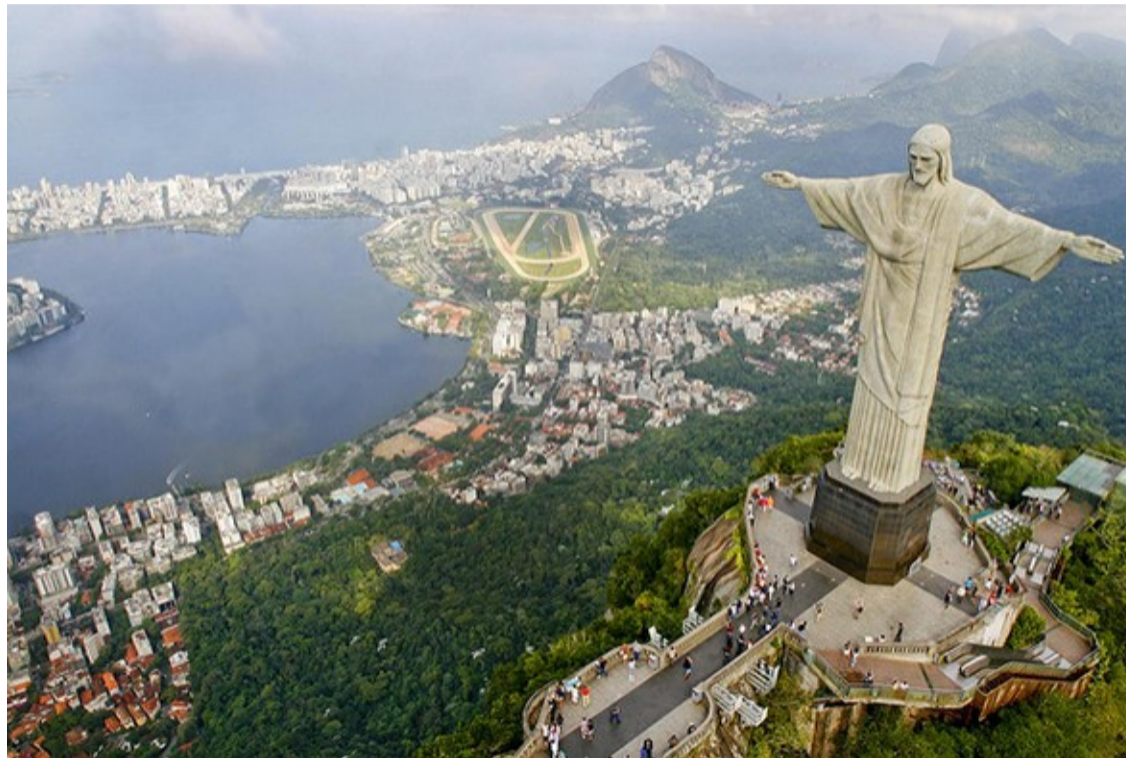
Christ the Redeemer

1 - CHRIST THE REDEEMER: With arms wide open over the Guanabara Bay, the Christ, the Redeemer blesses cariocas and visitors. Sitting atop the Corcovado mountain, the statue is one of the most sought-after sights. The world's largest and most famous art deco sculpture, the Christ is one of the seven wonders of the modern world. To get to the monument, visitors take a pleasant 20-minute train ride across the Tijuca Forest. The view is stunning.