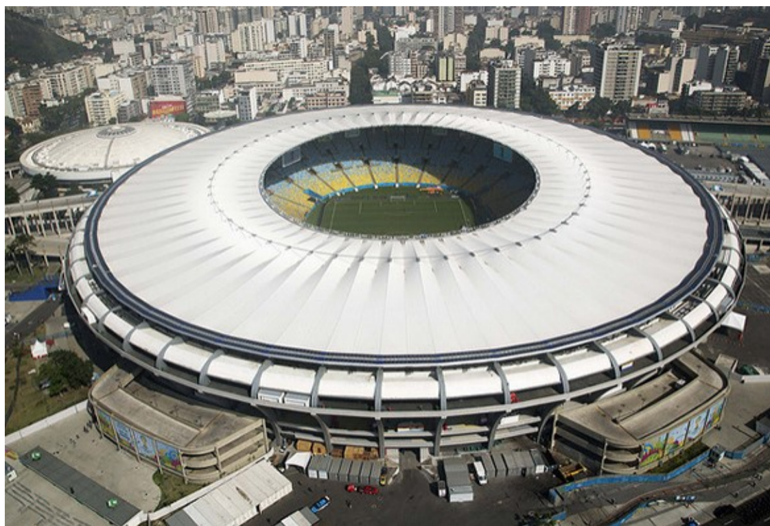
2014 World Cup, Maracanã

the opening and closing ceremonies for the 2007 Pan-American Games and the Olympic and Paralympic Games in 2016. Completely renovated, it also has a walk of fame and a museum.