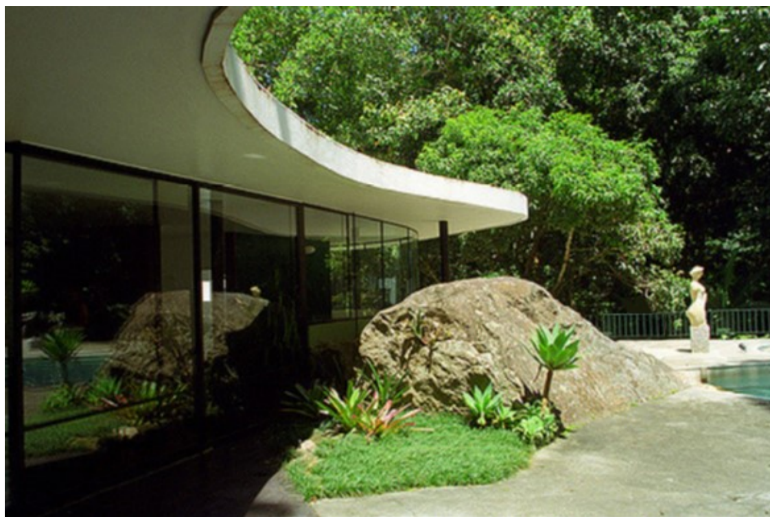
Casa das Canoas

:: Teatro Popular (Popular Theater): Located on the Guanabara Bay shores, the Oscar Niemeyer Popular Theater opens the Niemeyer Way, in Niterói, comprising a cultural and tourist complex designed by Niemeyer. Its concept is plural, proposing a programming that goes beyond of what is a theater, where it is possible to contact all the arts, combining music, photography, dancing, painting, leisure and theater in one place. (Av. Jornalista Rogério Coelho Neto s/n, Niterói).