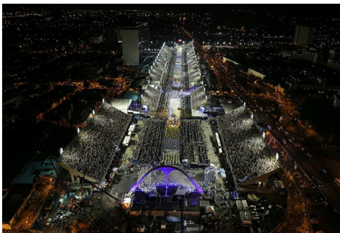
Portela | | https://www.flickr.com/photos/riotur/25364780647/in/album-72157691635258791

:: Sambódromo (Sambadrome): Opened in 1984, the stage of the samba school parade in Rio de Janeiro, which was also a venue for the 2016 Olympic Games and hosts concerts, is the architect's work. The highlight is the Praça da Apoteose, with its large arch. (Rua Marquês de Sapucaí s/n, Downtown).