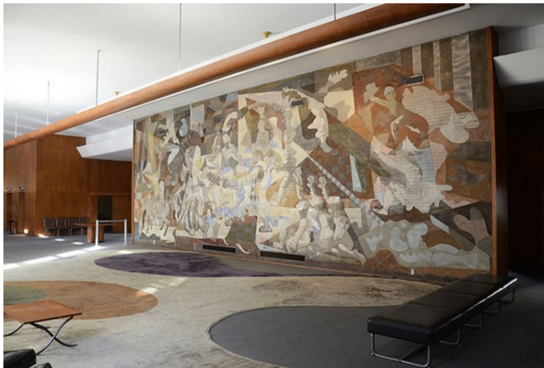
Gustavo Capanema Palace

:: Gustavo Capanema Palace: Opened in 1945, the project was led by Lúcio Costa and had a team of young architects of which Oscar Niemeyer was a part. The building rests on ten-meter pillars and its 16 stories were erected with iron, concrete and marble. It has a garden designed by Roberto Burle Marx and murals of glazed tiles by Cândido Portinari. (Rua da Imprensa 16, Downtown).