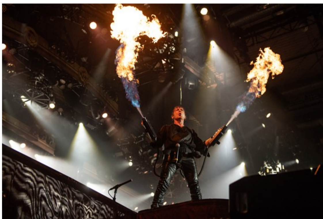
Iron Maiden, Legacy of the Beast Tour

In 2019, the festival celebrates 34 years of history, with 19 editions, over 2,000 artists and a total audience of 9.5 million people. To celebrate, a dedicated space will remember the year the world's biggest music and entertainment festival came to life: 1985. Route 85, which will be inspired by the iconic Route 66, promises a vintage scenario with entertainment points such as a rubber shop, a bar with memorabilia from the festival's 34-year history, a gas station and more.