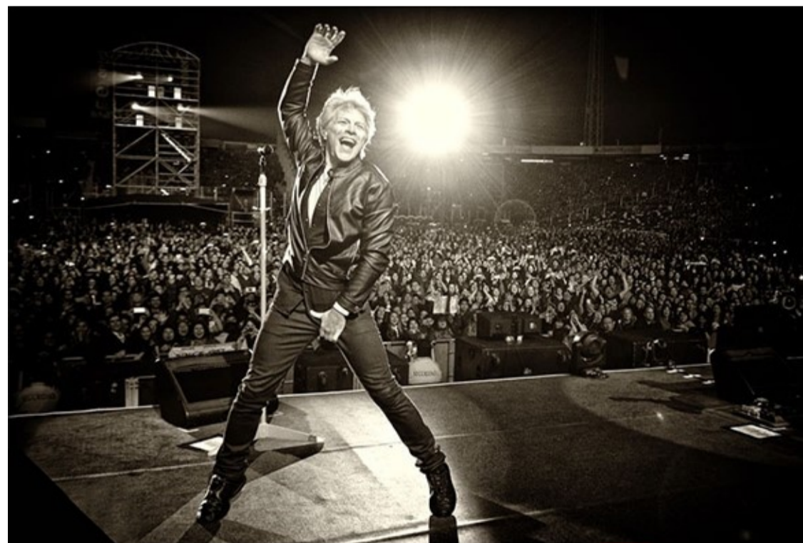
Bon Jovi | Santiago, CL – September 2017

Tickets go on sale on April 11, starting at 7 pm, at www.rockinrio.com . In the early sale of this edition, which happened in November last year, 198,000 cards were sold in less than two hours. Until then, those who bought in advance may go to the site and choose the day they day they'd like to go.