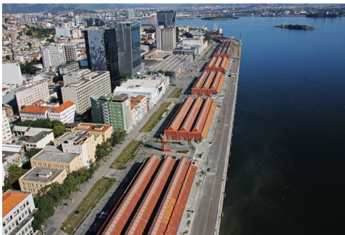
Orla Conde e Armazéns

Almost 10 years after its revitalization began, the Rio de Janeiro port area, which became a symbol of the 2016 Olympic and Paralympic Games, is being prepared for the arrival of seven new companies and two new leisure ventures: a gastronomic center and a Ferris wheel. In addition, the last VLT line begins operating until the end of the year, the modern train that runs through the downtown area, connecting the bus terminal to Santos Dumont airport.