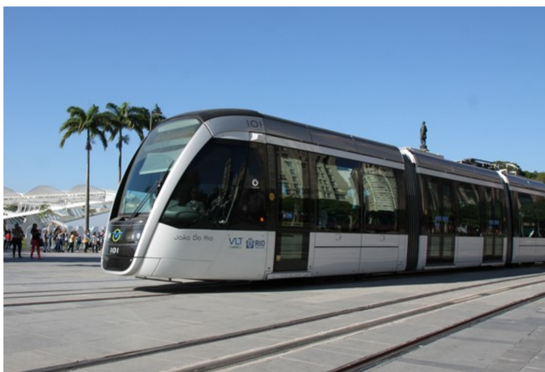
VLT Praça Mauá | Foto: Bruno Bartholini http://www.portomaravilha.com.br/fotos_videos/g/9

As the area grows, the city hall tests for the start of operation of the VLT Line 3, the last section of the system. The new line will connect the Central do Brasil, the Rio de Janeiro urban train station, to Santos Dumont airport, through avenues Marechal Floriano and Rio Branco. There will be three new stops and sections shared with lines 1 and 2, allowing intervals to be reduced to 3.5 minutes in the area of the Central do Brasil and in Rio Branco avenue, the city's primary financial corridor.