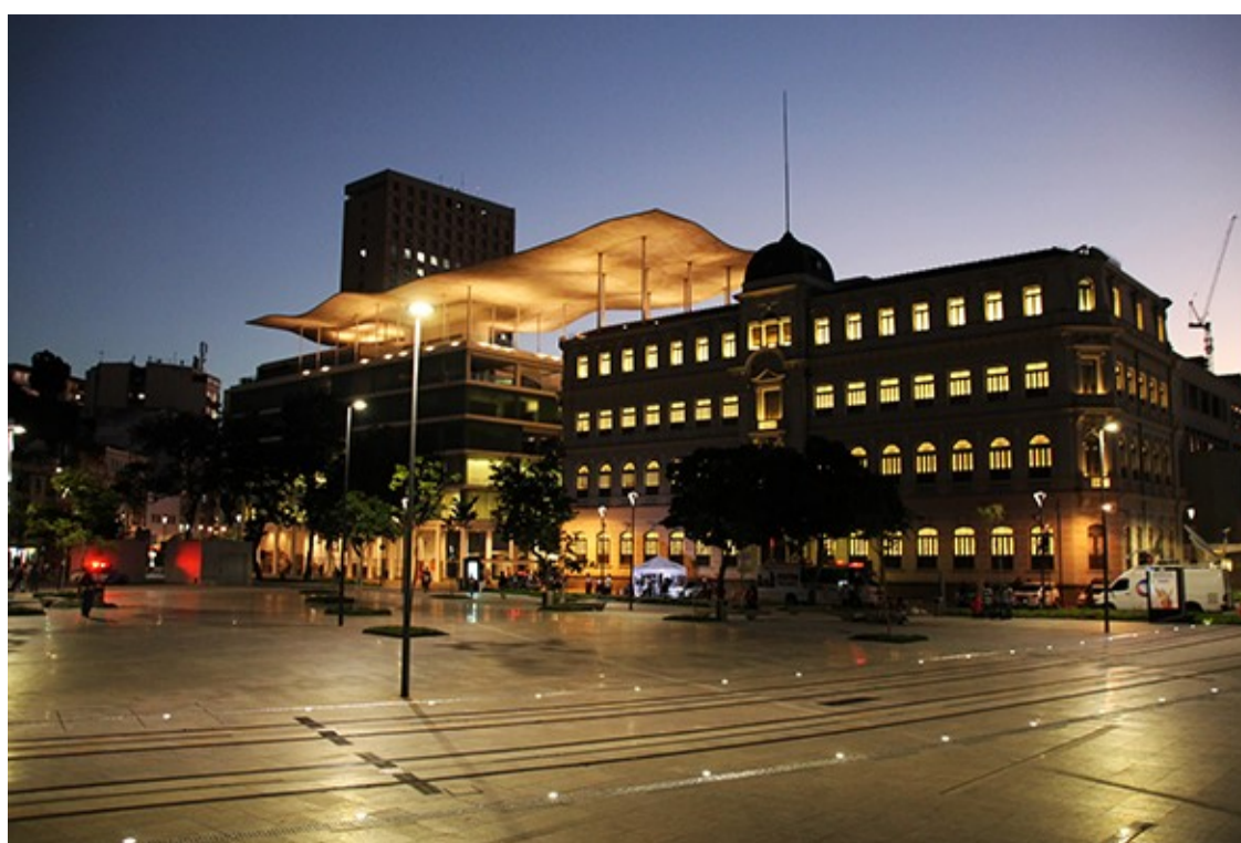
Museu de Arte do Rio | Foto: Bruno Bartholini | http://www.portomaravilha.com.br/fotos_videos/g/32

Mauá. On a monthly basis, 100,000 people are expected to pass by the location, which will have 20 full-time restaurants, among other ventures.