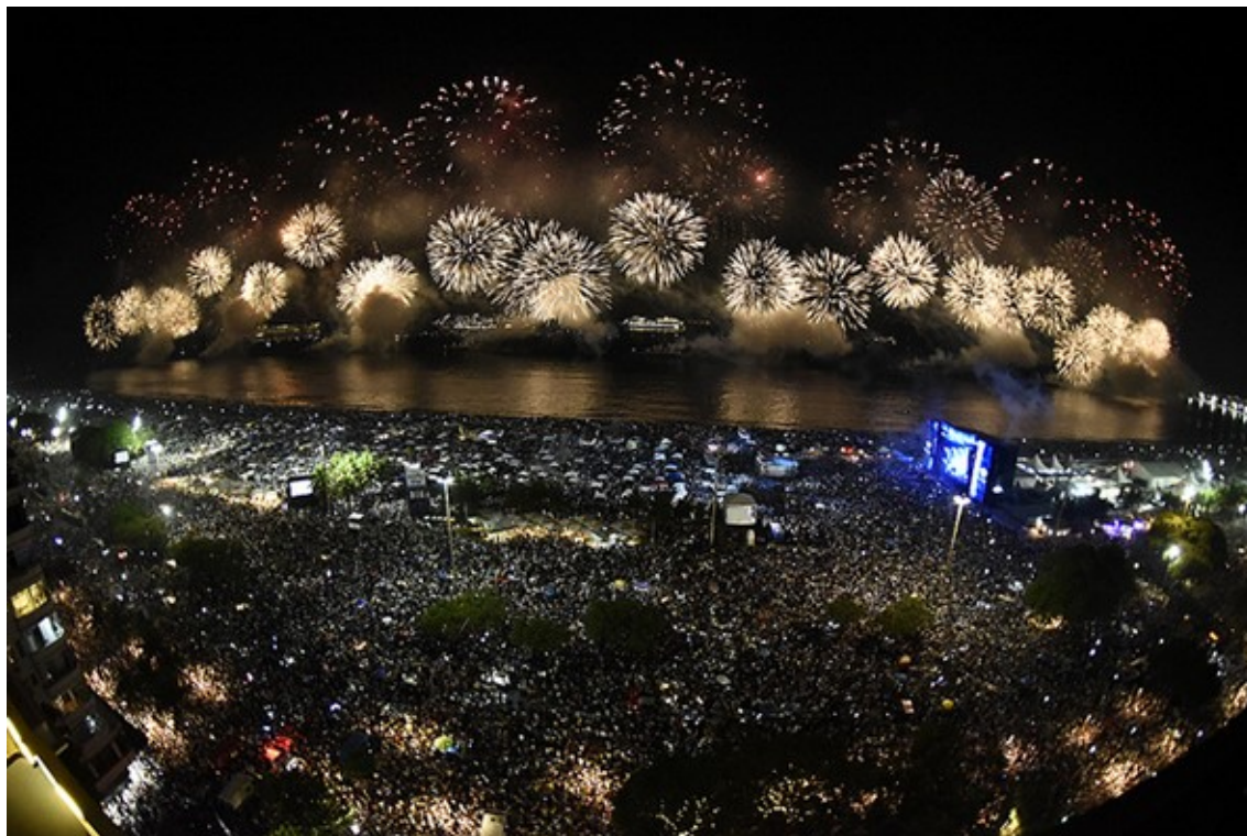
New Year's Eve Fireworks at Copacabana Beach