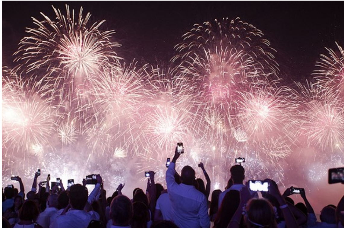
New Year's Eve Fireworks at Copacabana Beach

For the first time in history, the New Year's Eve celebration held at Copacabana Beach, in the Southern Zone of Rio de Janeiro, had more tourists than residents in the metropolitan area. The celebration - over 10 hours of concerts and 14 minutes of a firework display, gathered 2.8 million people, with 1.4 million tourists. The data are part of a survey conducted by Riotur - a company linked to the city hall, responsible for promoting tourism - on the night of December 31. Of the total number of visitors, 155,000 were foreigners and 1,245 from other parts of Brazil.