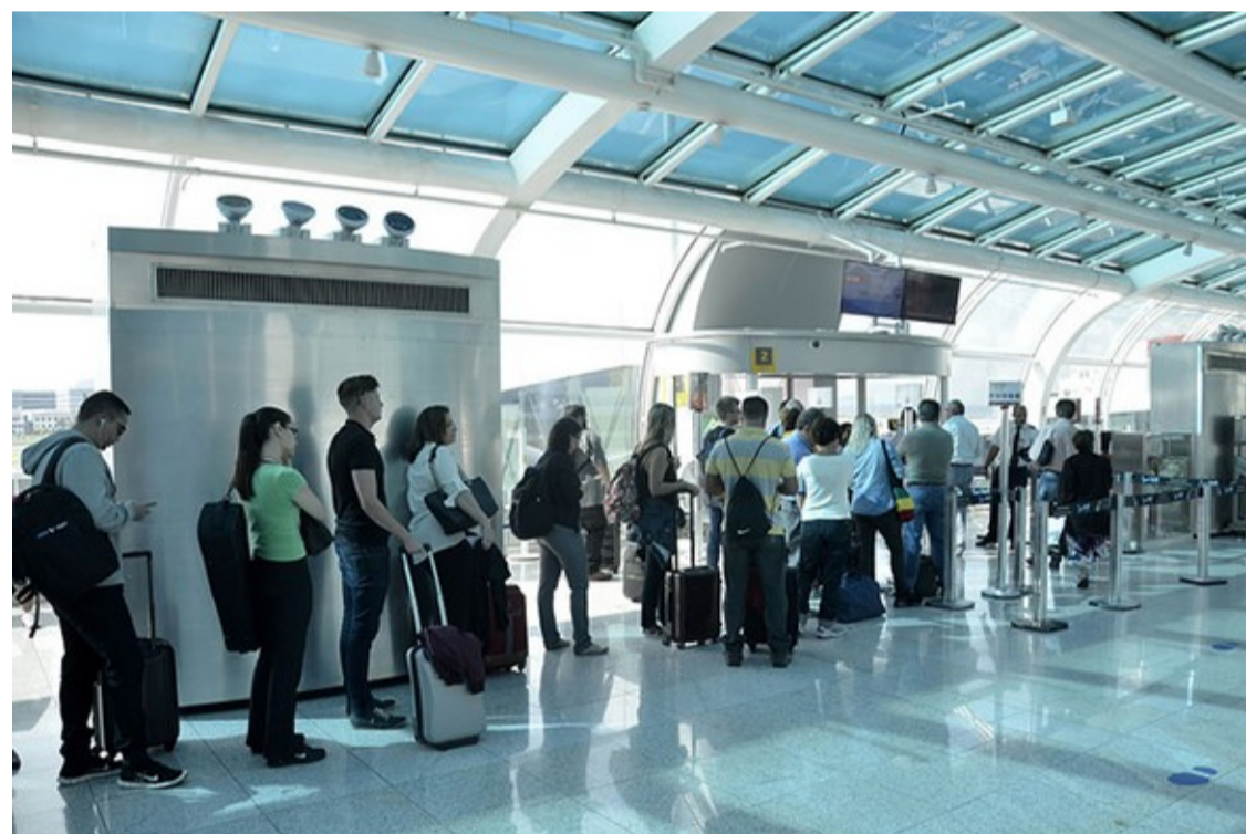
Aeroporto Santos Dumont

The survey, developed by Sabre Market Intelligence institute, also highlights among the five busiest routes domestic routes between Bogotá and Medellín, in Colombia, with 3.89 million passengers; between Los Angeles and San Francisco, in the US, with 3.66 million passengers; and between Los Angeles and New York, with 3.60 million passengers.